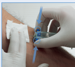
6 Aktivierung des Sicherheitsmechanismus