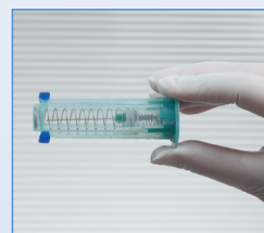
7 Aktivierter TIPGUARD