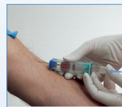
4 Einsetzen des Röhrchens