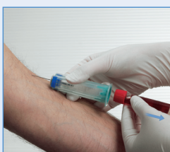
5 Abziehen des Röhrchens